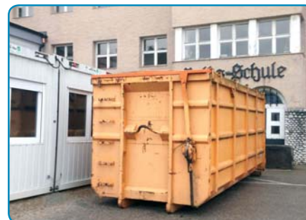
Der alte Eingang ist geschlossen.

Dieses Jahr wird ein sehr spannendes für alle Beteiligten. Die Bauarbeiten werden von uns allen Geduld, Toleranz und ein gewisses Maß an Flexibilität fordern. Aber schlussendlich werden wir in einer neu renovierten Schule lernen und arbeiten dürfen, die den Bedürfnissen der heutigen Pädagogik absolut gerecht wird.