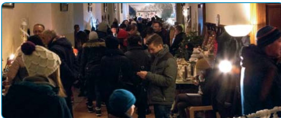
Innenräume Pfarrhof, linke Seite