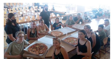
Abschlussfeier 4b TSMS (1)

Zum Abschluss des heuer etwas anderen Schuljahres hat der Elternverein die 4. Klassen bei ihrer individuellen Abschlussfeier kulinarisch unterstützt, indem wir die Kosten des Essens übernommen haben. Die Schüler ließen sich die bestellten Pizzen, Kesselheißer bzw. das Buffet vom hauseigenen Eventmanagement schmecken. Wir wünschen euch alles Gute für euren weiteren Lebensweg!