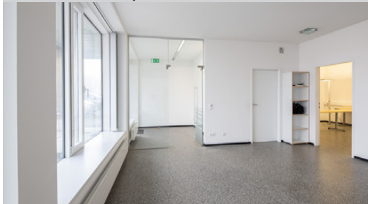
4643 Pettenbach, Büro 1616/2277

ideal für Freiberufler und Therapeuten ihr neuer Standort in bester Lage - ca. 96m 2 Nutzfläche Nettomiete: € 650,- HWB: 182/E; fGEE: 1,12/C Egon Graßegger 0676 - 846 126 722