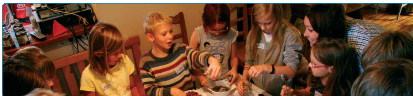
Ferienprogramm 2011 - Kräuterwerkstatt