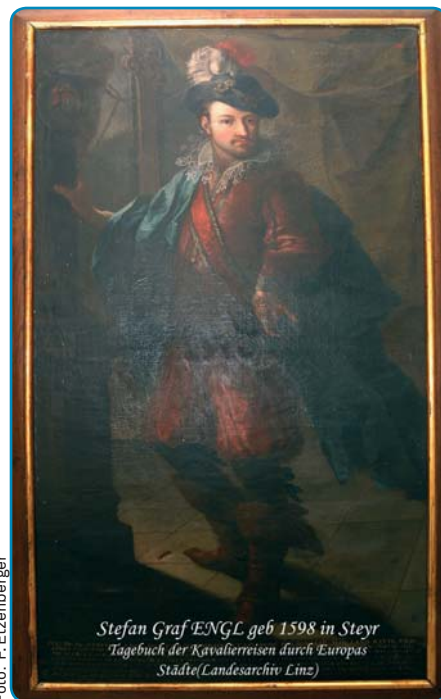
Foto der Ahnengalerie der Grafen Engl

Natürlich können Sie sich auch vom Stand der Renovierungsarbeiten auf der Ruine informieren.