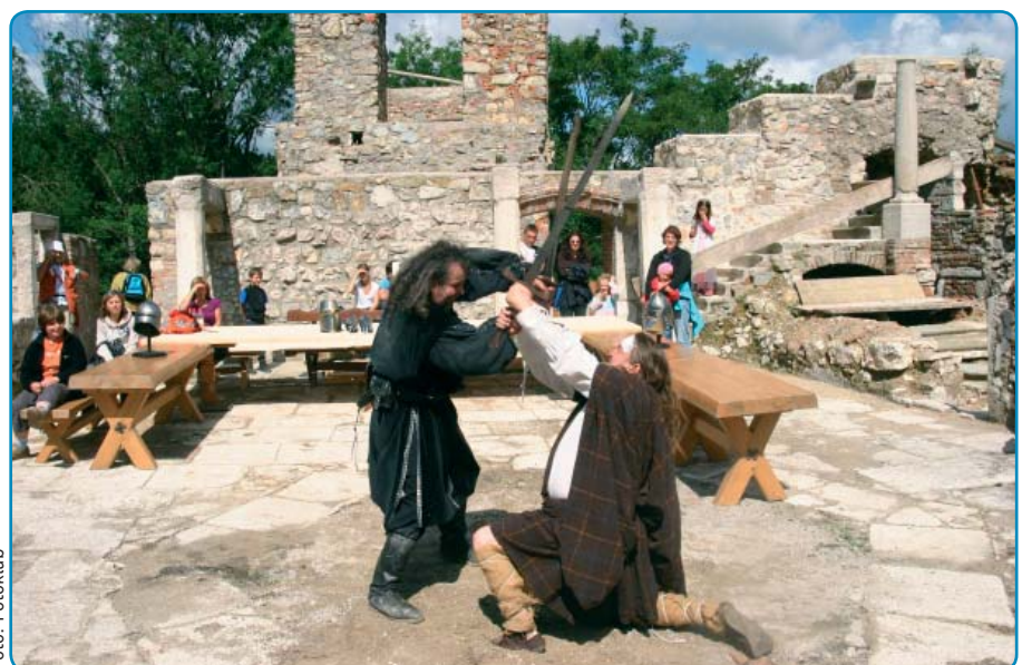
Ritteraufführungen, Schwertkämpfe, Bogenschützen, Greifvogelaufführungen und vieles mehr werden 2012 erwartet.