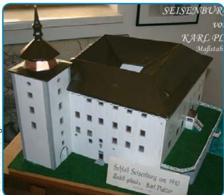
Modell vom Schloss Seisenburg