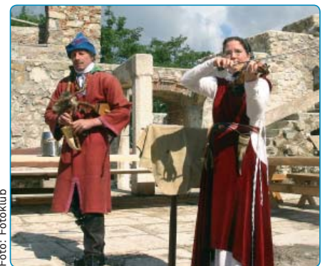
Mittelalterliche Musik auf dem Seisenburgfest 2009.